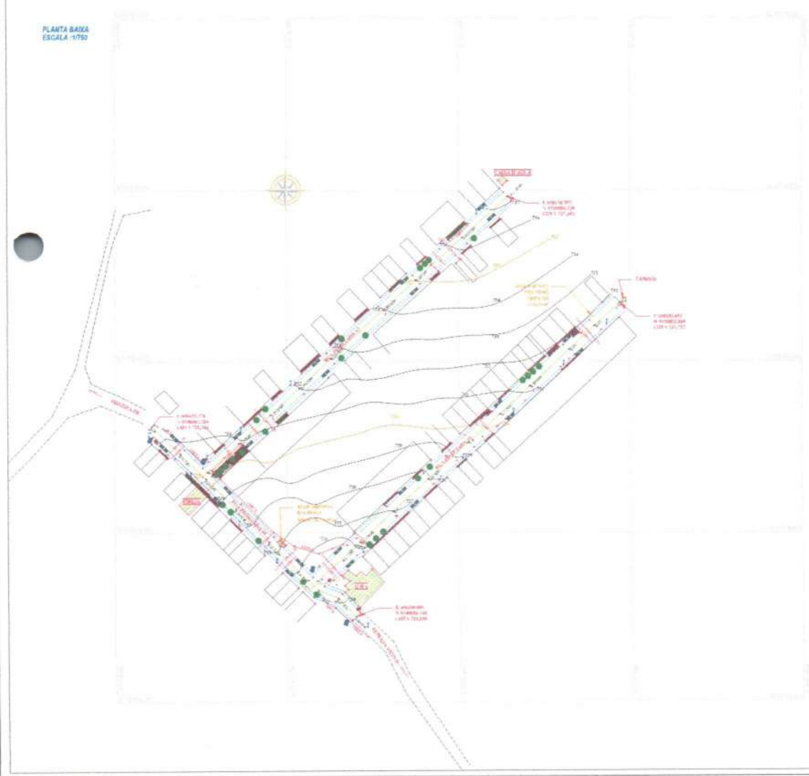
PLANTA BAIXA ESCALA 1:750

Este projeto foi elaborado em conformância com as normas técnicas vigentes e sob a supervisão de um profissional habilitado. O autor declara que não possui conhecimento de nenhuma situação que possa comprometer a veracidade das informações aqui contidas.